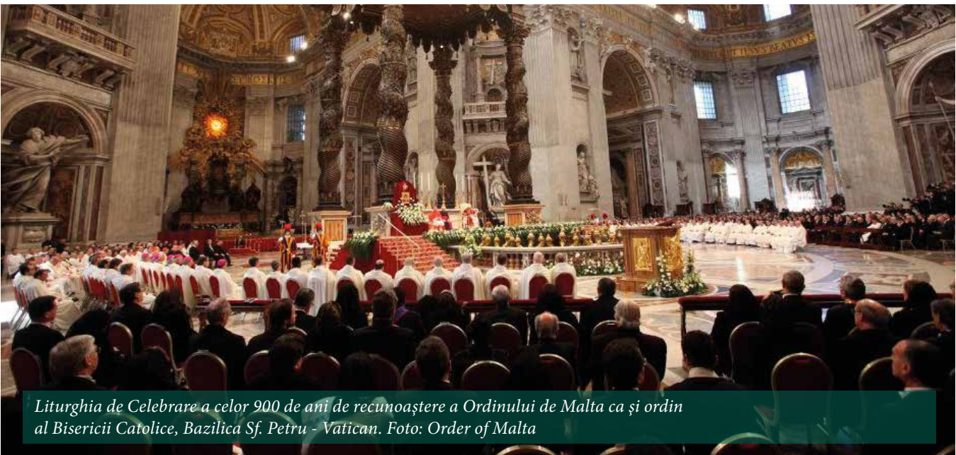
Liturghia de Celebrare a celor 900 de ani de recunoaștere a Ordinului de Malta ca și ordin al Bisericii Catolice, Bazilica Sf. Petru - Vatican.

Malteser Hilfsdienst (MHD) a celebrat în această toamnă la Aachen 60 de ani de existență, cu peste 1700 de participanți și invitați. Am fost și noi prezenți alături de acești prieteni, parteneri, susținători. Ei sunt cei care acum mai bine de douăzeci de ani au inițiat activitatea noastră de caritate în România și în celelalte țări foste membre ale blocului comunist. Cancelarul german Angela Merkel a declarat în mesajul său: „umanitatea și angajamentul pe care îl demonstrați în fiecare zi sunt un mare cadou pentru noi toți”, laudând activitatea Malteser Hilfsdienst cu cei 48.000 de voluntari în întreaga Germanie.