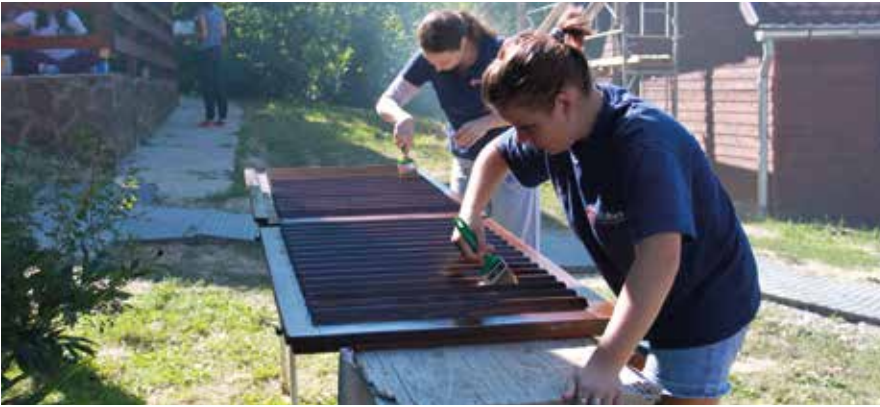
Pg. 18: Membri ai cercului de conducere TMR în cadrul Adunării generale.

Voluntari la Tabăra de muncă din Micfalău.