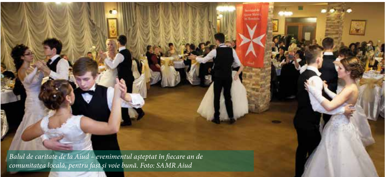
Balul de caritate de la Aiud – evenimentul așteptat în fiecare an de comunitatea locală, pentru fast și voie bună.

Balurile de caritate ■ Concert caritabil de colinde Mesaj de solidaritate