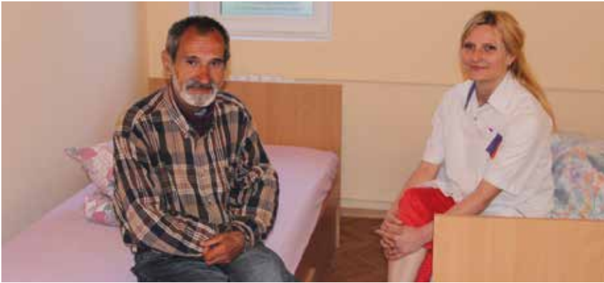
Pg. 24: Sesiune de lucru a reprezentanților din Europa Centrală și de Est în cadrul proiectului Tineret European.

Unul din beneficiarii adăpostului de noapte de la Sfântu Gheorghe, alături de psihologul proiectului