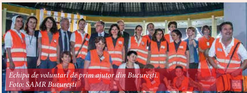
Echipa de voluntari de prim ajutor din București.

reprezentanți ai cultelor din România, circa 30 de membri ai familiei Ghika. În timpul liturghiei, IPSS Ioan Robu, arhiepiscop-mitropolit romano-catolic de București, a menționat munca extraordinară a tuturor voluntarilor SAMR, i-a felicitat și le-a mulțumit public pentru serviciile prestate.