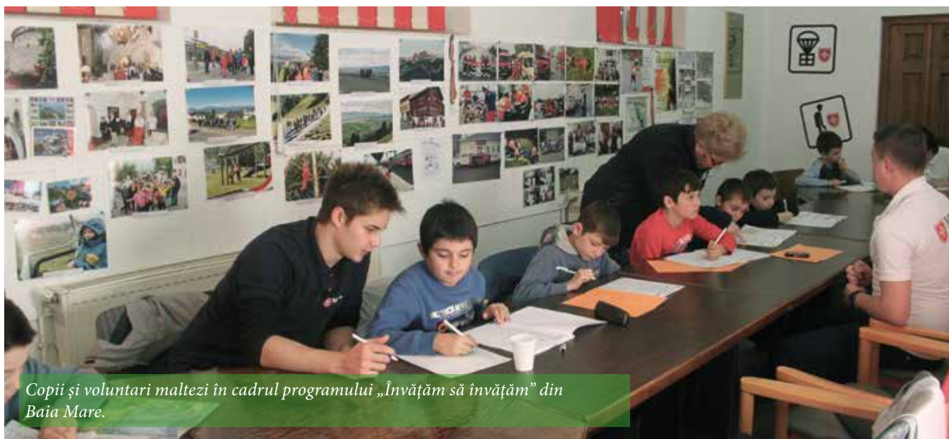
Copii și voluntari maltezi în cadrul programului „Învățăm să învățăm” din Baia Mare.

Proiecte de tip after-school ■ Tabere ■ Centrul de servicii sociale „Sfântul Iosif” Activități sociale complementare