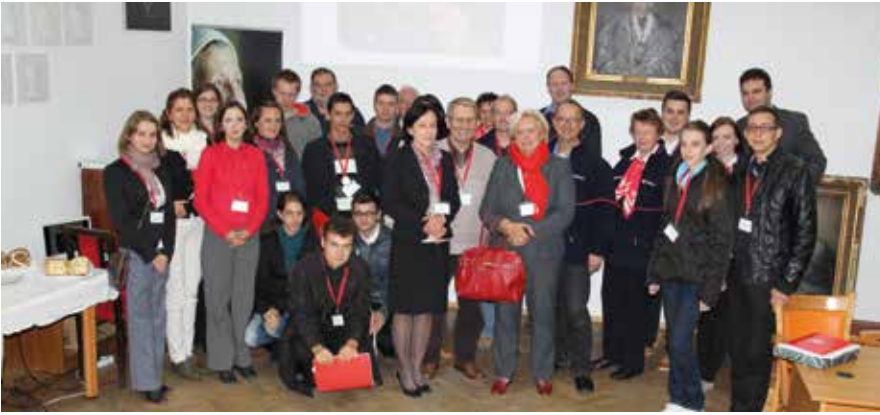
Pg. 26: Sfânta liturghie celebrată cu ocazia aniversării a 20 de ani de existență a sucursalei de la Aiud.

Reprezentanți ai SAMR și Malteser Hilfsdienst la „Zilele României”.