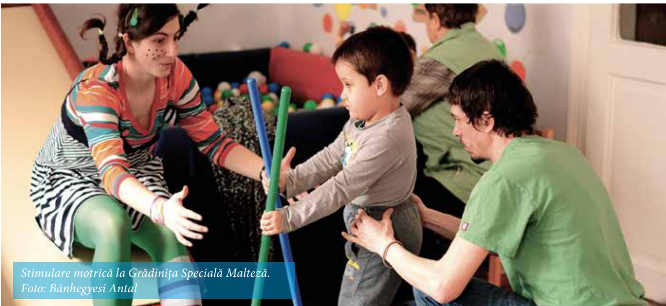
Stimulare motrică la Grădinița Specială Malteză.

Grădinița Malteză ■ Centrul de îngrijire pentru persoane cu handicap Cluburi pentru copii și tineri cu dizabilități ■ Tabere ■ Activități complementare