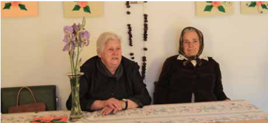
Clubul seniorilor, la Aiud.

■ Îngrijirea la domiciliu pentru persoane vârstnice este o activitate care se derulează la filiala Timișoara în beneficiul a 50 de seniori. Personalul calificat în îngrijirea vârstnicilor le oferă persoanelor dependente, imobilizate, servicii de asistență medicală, ajutor în menținerea igienei corporale, suport în livrarea hranei, sprijin în menajul casnic, consiliere cu privire la drepturile sociale legale, pachete alimentare lunare.