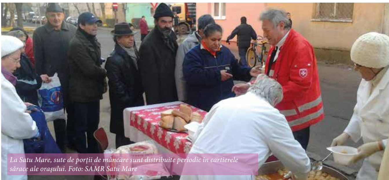
La Satu Mare, sute de porții de mâncare sunt distribuite periodic în cartierele sărace ale orașului.

Dotarea instituțiilor ■ Membri ai Ordinului de Malta alături de nevoiași