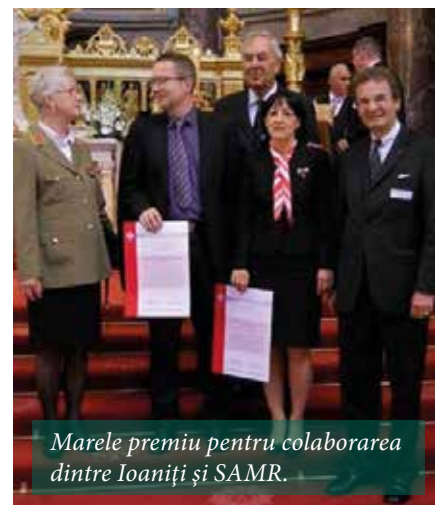
Marele premiu pentru colaborarea dintre Ioaniți și SAMR.

■ Ordinul Maltez și Ordinul Ioanit - o colaborare de succes, premiată la Berlin Ordinul Maltez și Ordinul Ioanit din Germania au sărbătorit aniversarea a 900 de ani de la emiterea Bulei papale „Piae postulatio voluntatis” de către Papa Pascal II. Colaborarea de-a lungul timpului dintre Ordinul Ioanit și Ordinul de Malta a fost evidențiat prin premiera celor mai de succes proiecte ecumenice comune, la Berlin. Marele premiu a fost acordat cooperării eficiente și de lungă durată dintre SAMR și Johanniter-Unfall-Hilfe din Landesverband Sachsen-Anhalt / Thüringen.