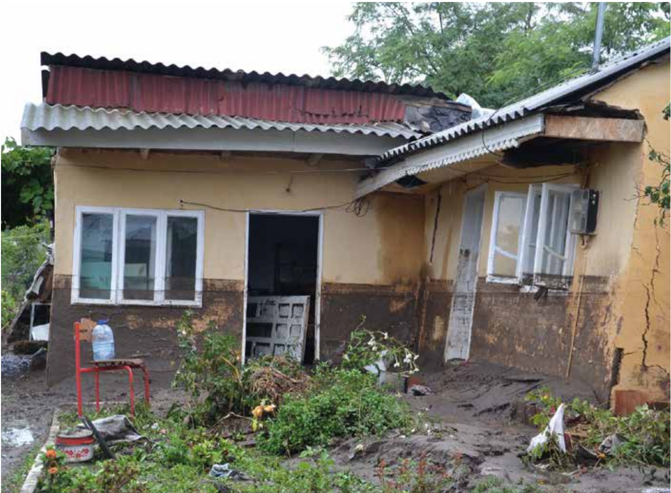
Locuință afectată de inundațiile din toamna anului 2013, județul Galați.

din domeniul umanitar la nivel național și internațional, să fie un pol de expertiză, să inițieze campanii de fundraising pentru acțiunile umanitare și să desfășoare proiecte comune în domeniu. FOND este Federația Română a Organizațiilor Neguvernamentale pentru Dezvoltare ce cuprinde organizații interesate să acționeze în domeniul cooperării pentru dezvoltare.