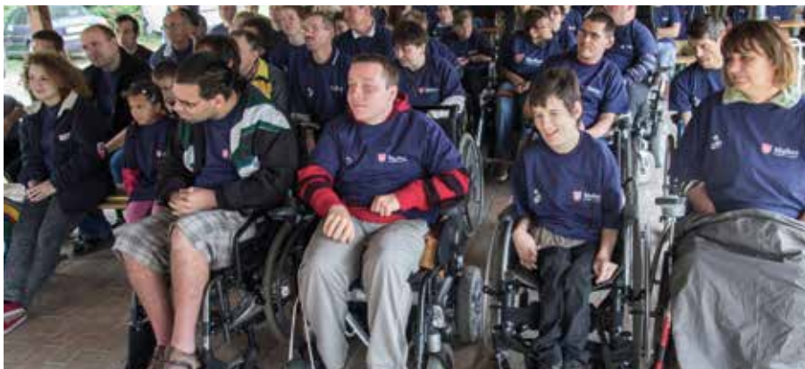
Stânga sus și dreapta jos – imagini de la Tabăra pentru tineri cu dizabilități locomotorii, Vâlcele.

adaptat nevoilor fiecăruia în parte, cu activități desfășurate pe grupe de vârstă și în funcție de tipul de dizabilitate: activități de stimulare cognitivă și a limbajului, corectarea tulburărilor de vorbire, consiliere psihologică, consiliere vocațională, activități de stimulare a creativității și imaginației în cadrul atelierelor de creație, vizionare de filme, îndrumare spirituală, organizare de excursii. Proiectul filialei Sfântu Gheorghe inițiat în toamna anului 2013 se derulează în beneficiul a 6 tineri cu dizabilități, cu vârste între 18 și 35 de ani. Pornind de la nevoile specifice fiecărui beneficiar în parte, acestora le sunt propuse activități menite să îi sprijine în procesul de integrare socială și care să le faciliteze o mai bună cunoaștere de sine: activități de lucru manual, sărbătorirea în comun a zilelor de naștere, schimb de experiență cu alte sucursale malteze, instruire în prim ajutor de bază, activități recreative, organizare de excursii etc.