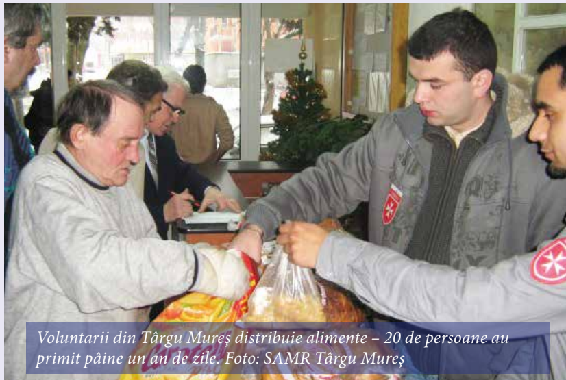
Voluntarii din Târgu Mureș distribuie alimente – 20 de persoane au primit pâine un an de zile.

sărmani, este oferită cu regularitate vârstnicilor din oraș. Eforturile campaniei de sensibilizare a contribuabililor de a direcționa 2% din impozitul pe venit în folosul acestora, dau roade. La sumele asigurate astfel se adaugă și alte inițiative, cum a fost „Crosul de Moș Nicolae”, unde peste 250 de adulți și copii și-au dat concursul pentru adunarea sumei necesare asigurării pâinii pe parcursul unui an întreg pentru 6 vârstnici.