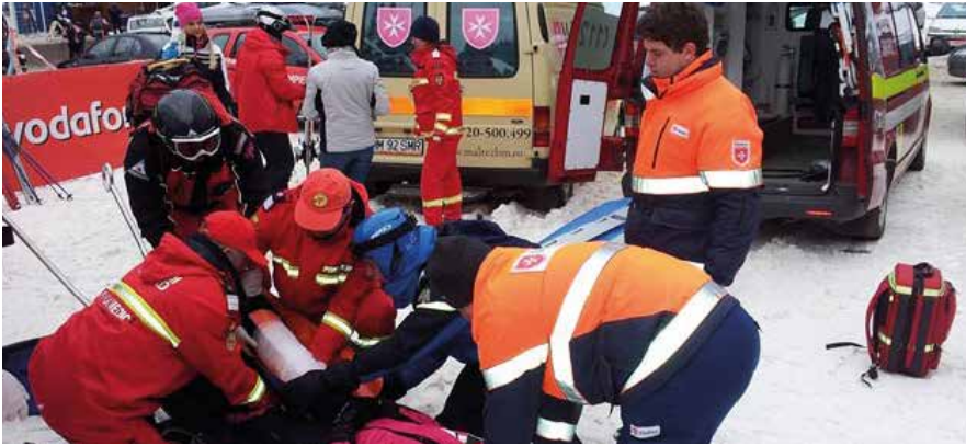
Voluntarii maltezi din grupele de prim ajutor, la diverse exerciții de simulare de intervenții la Sfântu Gheorghe (Pg. 14) și Baia Mare.

Liceului Teoretic „Székely Mikó”. 17 cadre didactice și 20 de elevi au terminat cursul. Scopul acestei inițiative este ca în fiecare clasă cel puțin 2 elevi să poată acorda primul ajutor în caz de nevoie. La Baia Mare, acest tip de cursuri este deja o tradiție. Aici voluntarii maltezi dezvoltă la nivelul școlilor maramureșene adevărate „celule” de prim ajutor formate din elevii instruiți.