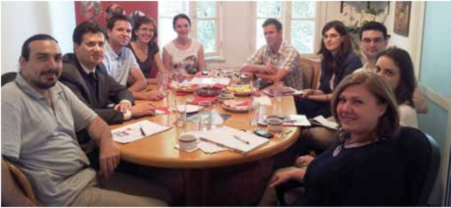
Pg. 16: Voluntari din Micfalău distribuie sobe celor afectați de inundațiile din toamna 2013.